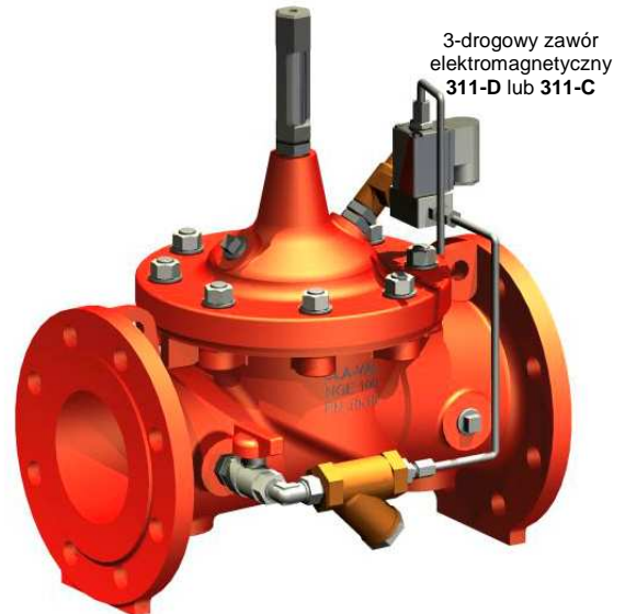
3-drogowy zawór elektromagnetyczny 311-D lub 311-C

Zawór serii 136 ze sterowaniem elektrycznym reguluje natężenie przepływu lub ciśnienie w zależności od zdalnie sterowanego impulsu elektrycznego. Zawór serii 136 E/D działa w trybie otwierania/zamykania. Zawór serii 136 pracuje w trybie stopniowym